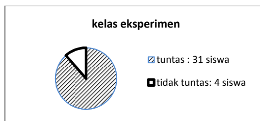
Diagram 1. Ketuntasan kemampuan komunikasi matematis siswa

Hasil tes evaluasi kemampuan komunikasi matematis yang diberi perlakuan dengan menggunakan model pembelajaran Three Step Interview dengan pendekatan pendidikan karakter, dilakukan uji ketuntasan individual dengan Kriteria Ketuntasan Minimal (KKM) = 73 dan diperoleh hasil yaitu t_{\text{hitung}} = 8,10 dan t_{\text{tabel}} = 1,6909 dengan dk = n - 1 = 35 - 1 = 34 . Sehingga dapat disimpulkan bahwa kemampuan komunikasi matematis pada model pembelajaran Three Step Interview dengan pendekatan pendidikan karakter mencapai KKM dengan nilai rata-rata yang diperoleh seluruh peserta didik sebesar 84,40.