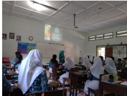
Gambar 2. Suasana kegiatan belajar mengajar

Berdasarkan hasil observasi yang telah dilakukan pada saat proses pembelajaran di kelas XI MIPA 2, XII MIPA 3, dan lingkungan sekolah maka dapat diamati bahwa guru sudah melaksanakan komunikasi secara santun, empatik, dan efektif; menghargai siswa, guru, dan warga sekolah; mampu menggunakan teknologi komunikasi dan informasi secara fungsional; mampu menunjukkan pribadi yang dewasa dan teladan, memiliki etos kerja, tanggung jawab yang tinggi, dan memiliki rasa bangga menjadi seorang guru.