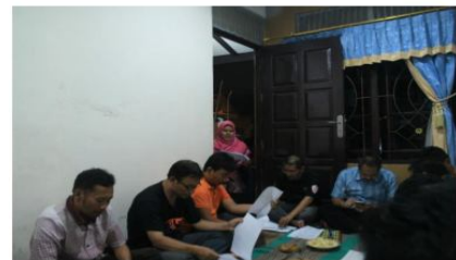
Gambar 3. Sosialisasi dan pengenalan

dalam penggunaan adsorben tersebut. Standart baku mutu air secara umum juga dijelaskan pada kegiatan tersebut. Gambar 3 menunjukkan foto tentang sosialisasi kegiatan yang berbarengan dengan kegiatan rutin warga yaitu arisan. Antusias warga dalam menyimak dan memperhatikan sosialisasi ini sangat mengagumkan. Kegiatan ini ditutup dengan diskusi bersama warga setempat terkait program selanjutnya. Keantusiasan warga terlihat ketika pengajuan kepala keluarga yang berencana menggunakan penyaring bersusun. Dukungan dari ketua RT setempat sangat membantu dalam program ini.