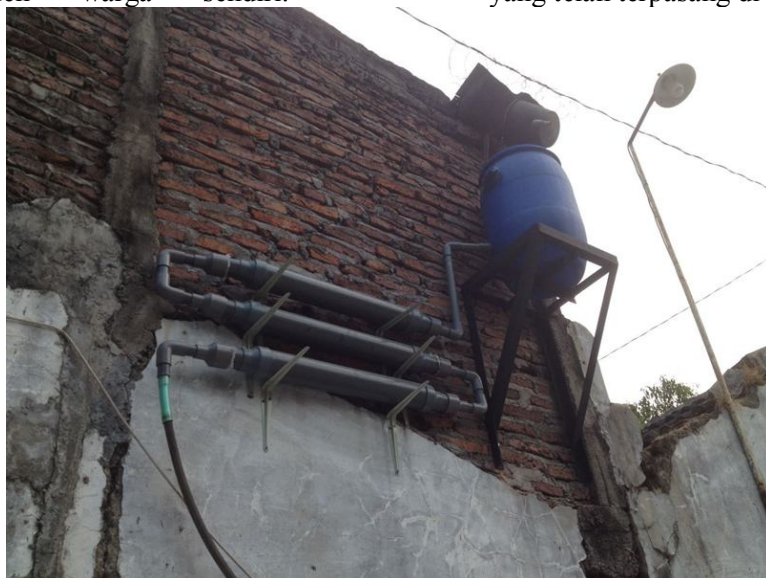
Gambar 7 Hasil Pemasangan Penyaring Pipa Bersusun

Pertimbangan tersebut dikarenakan untuk mempermudah dalam pembersihan, kemudahan proses aliran dan kekuatan tembok penahan tandon. Gambar 7 merupakan gambar penyaring pipa bersusun yang telah terpasang di warga.