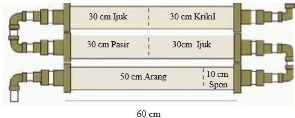
Gambar 5. Penyaring Bersusun Hasil Modifikasi Fafa (2011)

adsorben yang diberikan maka semakin bersih hasil yang diperoleh. Akan tetapi waktu yang dibutuhkan lebih lama. Hal ini dinyatakan oleh Gusdi (2013) bahwa kecepatan debit dipengaruhi oleh ketebalan dari bahan adsorben. Ketebalan adsorben pasir mampu memberikan hasil kejernihan yang maksimal. Pasir dapat menjernihkan air secara optimal. Ketebalan yang tinggi mampu mereduksi pengotor lebih tinggi juga. Selain pasir, adsorben yang lain berupa arang, ijuk dan spon memiliki manfaat untuk filter atau menghilangkan bau, warna, zat pencemar dalam air, sebagai pelindung dan penukaran resin dalam alat penyaring bersusun