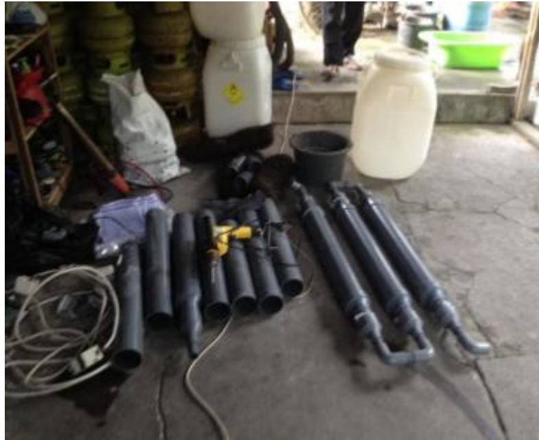
Gambar 2. Alat dan Bahan Pembuatan Penyaring pipa Bersusun

Selain bahan tersebut, kebutuhan besi atau baja ringan sebagai tempat tandon juga disiapkan dengan baik. Kegiatan untuk prepare alat dan bahan dilaksanakan bersama-sama dengan warga meteseh.