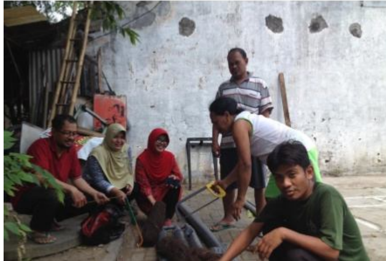
Gambar 6. Pemasangan Pipa Bersusun di kelurahan meteseh

kelurahan meteseh. Gambar 6 merupakan gambar proses pemasangan penyaring bersusun di rumah salah satu warga.