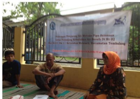
Gambar 4. Sosialisasi dan praktik

Kegiatan praktik pembuatan alat penyaring ini diawali dengan pelatihan secara teoritik dalam pembuatan penyaring bersusun dengan memanfaatkan adsorben yang ada dilingkungan masyarakat. Gambar 5 merupakan gambar pengarah tentang alat dan bahan yang perlu disiapkan.