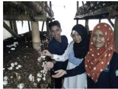
Gambar 7. Badan buah jamur merang yang sudah terbentuk.