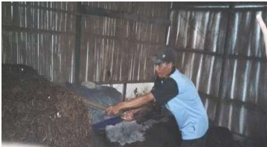
Gambar 5. Proses pengomposan media tumbuh jamur merang

Untuk mempercepat proses pelapukan media, Anda bisa melakukan prosesfermentasi dengan cara memotong jerami padi atau eceng gondok dengan ukuran 10-15cm, campur dengan kapas, dan kapur lalu rendam dalam air selama24 jam. Setelah itu angkat campuran media tersebut dan tumpuk di atas lantaidenganukuran1,5 mx 1,5 mx 1,5 m