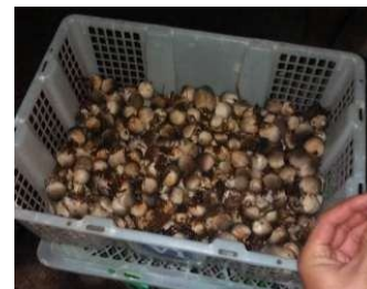
Gambar 8. Jamur merang hasil budidaya dengan eceng gondok.

Tujuan: menghindari jamur menjadi mekar, layu, salah petik dan menjaga agar memetik jamur tepat waktunya.