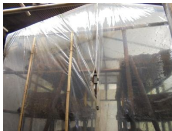
Gambar 4. Kumbang jamur merang

Kumbang jamur yang dibuat oleh pemuda desa Asinan terbuat dari rangka bambu dengan dinding serta atap dari plastik UV transparan.