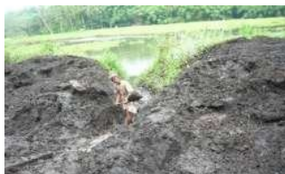
Gambar 3. Humus enceng gondok

Diskusi selanjutnya berupa penentuan kegiatan penyuluhan dan pengembangan karang taruna. Berdasarkan analisis kebutuhan diperoleh bahwa budidaya jamur champignon tidak jauh berbeda dengan jamur merang. Adanya beberapa kendala budidaya jamur champignon (suhu asinan yang mengalami kenaikan pada tahun terakhir) asinan maka dilakukan pencarian solusi, akhirnya ditinjau dari akar permasalahan diperoleh solusi yaitu budidaya jamur merang menggunakan substrat enceng gondok. Bahan baku media budidaya jamur champignon/merang, berupa media organik yang mengandung banyak selulosa, misal jerami atau enceng gondok. Hasil observasi menunjukkan bahwa humus yang sudah jadi seperti pada gambar 1 tidak dapat digunakan sebagai media tumbuh jamur merang karena sudah tercemar kontaminan.