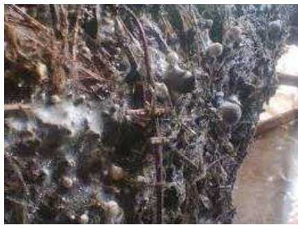
Gambar 6. Pertumbuhan miselium pada masa inkubasi.