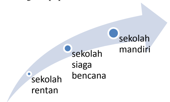
Gambar 3. Tahapan Menuju Sekolah Mandiri Bencana

Ini menunjukkan bahwa model pembelajaran pendidikan bencana bervisi SETS mampu menyadarkan peserta didik tentang peranan mereka dalam menghadapi potensi bencana.