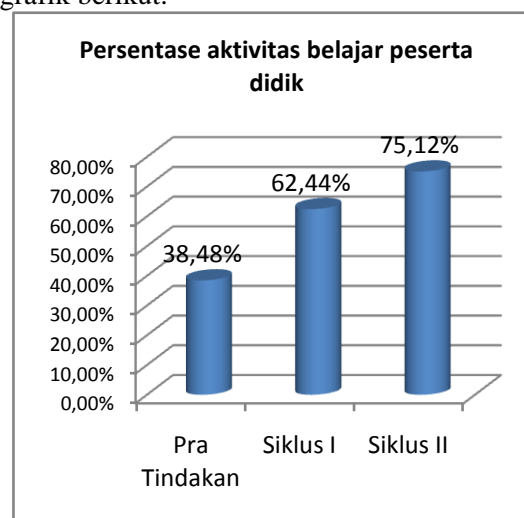
Gambar 1. Persentase Aktivitas Belajar Peserta didik

Sebelum adanya tindakan pada pembelajaran yaitu tahap pra siklus diketahui bahwa rata-rata aktivitas belajar peserta didik mencapai 43,55%. Setelah pelaksanaan tindakan pada siklus I diketahui bahwa rata-rata aktivitas belajar peserta didik mencapai 61,88% Jika dibandingkan dengan capaian rata-rata aktivitas belajar peserta didik sebelum adanya tindakan, maka dapat diketahui bahwa terjadi peningkatan persentase rata-rata aktivitas belajar. Capaian persentase rata-rata aktivitas belajar peserta didik pada Pra Siklus, siklus I dan siklus II terdapat pada grafik berikut.