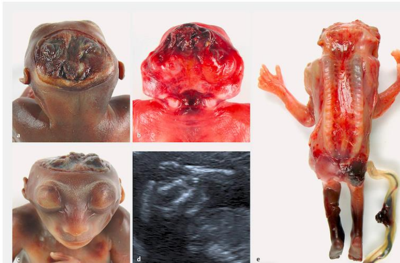
Gambar 2. Anensefali sebagai salah satu bentuk neural tube defect .(11)

Faktor risiko yang paling besar menyebabkan kelainan kongenital di Provinsi Shanxi, China, adalah tidak mengonsumsi asam folat selama hamil, disusul gaya hidup tidak sehat dan pendidikan ibu yang rendah.(12) Selain asam folat, calon ibu yang kekurangan yodium akan menyebabkan janinnya lahir dengan kadar yodium rendah sehingga janin tersebut akan tumbuh dengan disabilitas intelektual. Sebuah penelitian di Australia menemukan asosiasi antara defisiensi yodium ringan pada ibu selama masa kehamilan dengan gangguan memori dan kecepatan proses mendengar pada anak yang dikandungnya.(13)