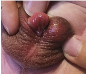
Gambar 3. Hipospadia.(26)